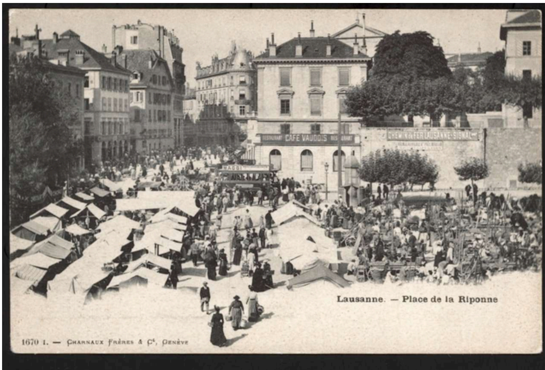
Lausanne. — Place de la Riponne

1670 I. — CHARNAUX FRÈRES & C e , GENÈVE